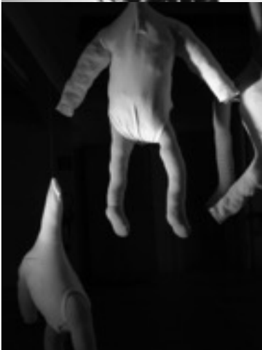
recherche d'objets scénographiques pour l'étape 1