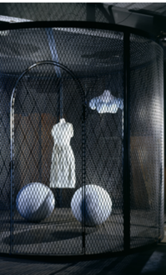
Louise Bourgeois « Cell XXV »