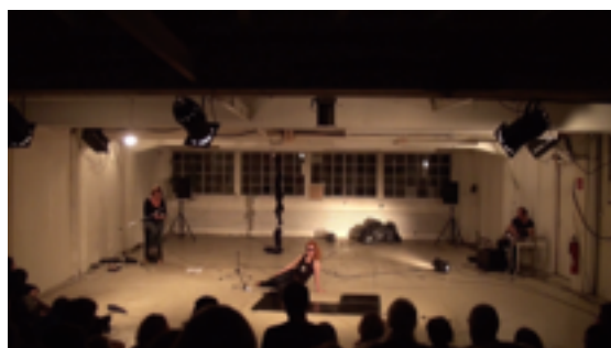
Médée, poème enragé -journées TacTacTac 2015 (images extraites de la captation)