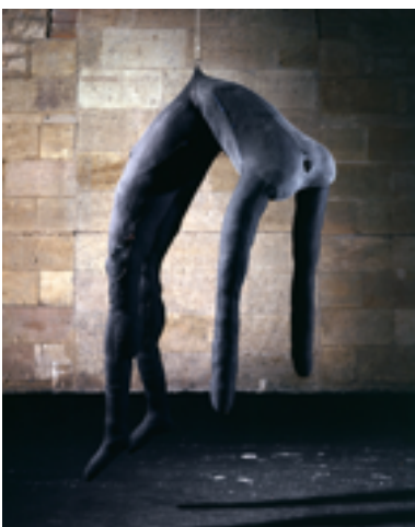
Louise Bourgeois « A Woman Without Secret 1 »