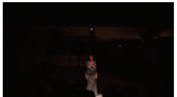
Médée, poème enragé -journées TacTacTac 2015 (images extraites de la captation)